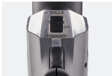
デュアルスピードボルト締め

シンプルなスイッチで、リチウムシリーズは高速ダウンモードから正確な最終トルクモードに移行し、ジョブで複数のシステムを使用する必要がなくなります。精密機械加工されたギアボックスは、インパクトガンに見られる振動や騒音なしに一定のパワーを提供します。ガンの背面にあるデジタル表示を介して電源を調整し、あらゆるジョブのトルク出力を微調整します。