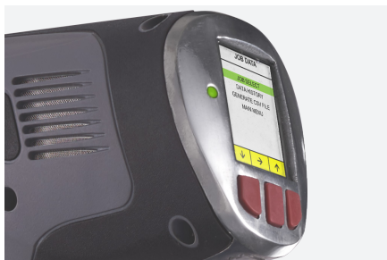
インダストリアルグレードパワー

リチウムシリーズは、航空宇宙等級の材料を使用して設計されたもので、工業用耐久性とパワーを備えたコンパクトなデザインを提供します。アルミニウム合金の頑丈な部分から切り取った金属フレームは、工業用作業の損傷からツールを保護します。36ボルトのバッテリーは、最も厳しいボルトジョイントを通過する力を与えます。