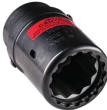
HYTORC Washer und Aufsatz

Das Unterlegscheibensystem HYTORC Washer kann anstelle der Drehmomentstütze für alle Anwendungen verwendet werden.