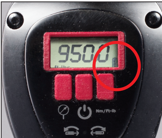
Digital jGUN Batterieanzeige und USB-Anschluss