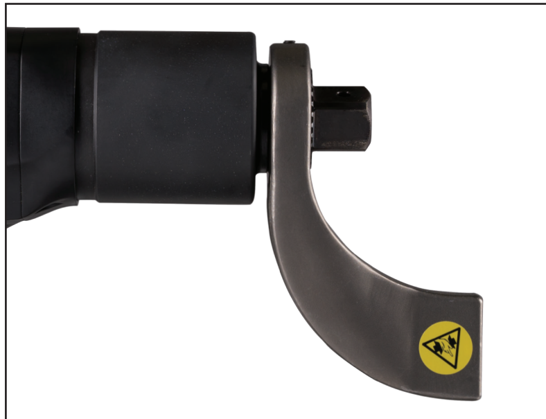
Installation einer Drehmomentstütze