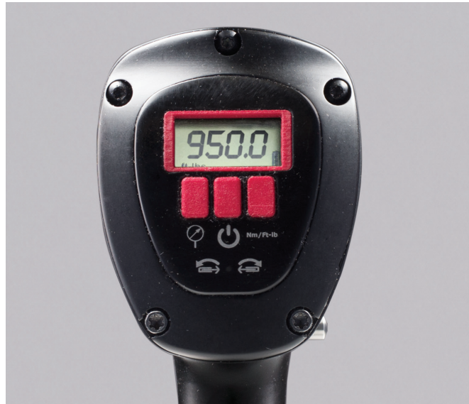
Anzeige der Digital jGUN