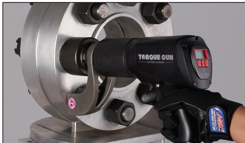
Einsatz der Digital jGUN