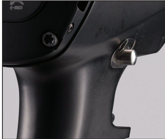
Digital jGUN Richtungswahlschalter