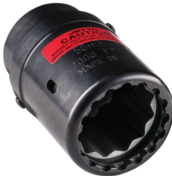
HYTORC Washer und Stecknuss

Neben der zusätzlichen Sicherheit, keine externen beweglichen Teile zu haben, bietet das Unterlegscheibensystem HYTORC Washer ein universelles Widerlager für alle Anwendungen, wodurch die Notwendigkeit speziell angefertigter Drehmomentstützen entfällt. Gleichzeitig verhindert das Gewindegsegment in der Unterlegscheibe das Drehen des Bolzens, was Sicherungsschraubenschlüssel überflüssig macht. Durch das Festziehen und Kontern auf der selben Achse wird die Außenlast eliminiert und die Oberflächenreibung von Mutter zu Mutter wird ausgeglichen, was Ihnen eine höhere Verschraubungsgenauigkeit bietet.