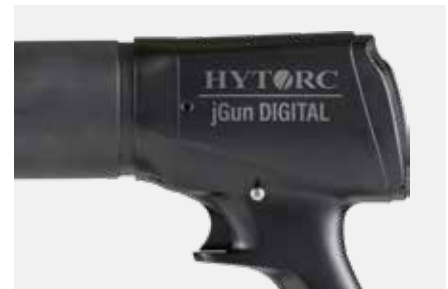
工業グレードモーター

jGun DIGITAL Single Speed に搭載された新しいモーターは、重工業用に設計された作業馬です。最大重量対重量比と頑丈な耐腐食性設計により、このモーターはエアフィルタと潤滑システムを別途設ける必要がなくなり、jGun DIGITAL Single Speed は市場で最もポータブルな空気圧式トルクガンとなります。