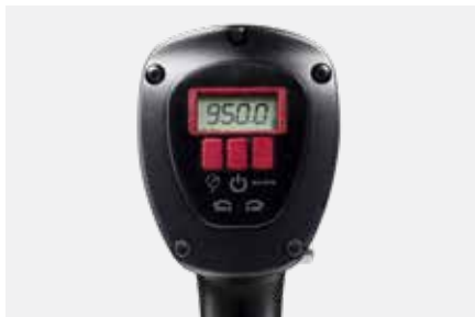
デジタル・リードアウト

jGun DIGITAL Single Speed は、デジタル読み出しとFRLフリー動作を備えた世界で初めてのトルク調整可能な空気圧式乗算器です。別個のフィルタ、レギュレータ、および潤滑システムが必要な他のシステムとは異なり、特許取得済みのjGun DIGITAL Single Speed の設計は、このアドオンがポータビリティと利便性の最高レベルの必要性を排除します。