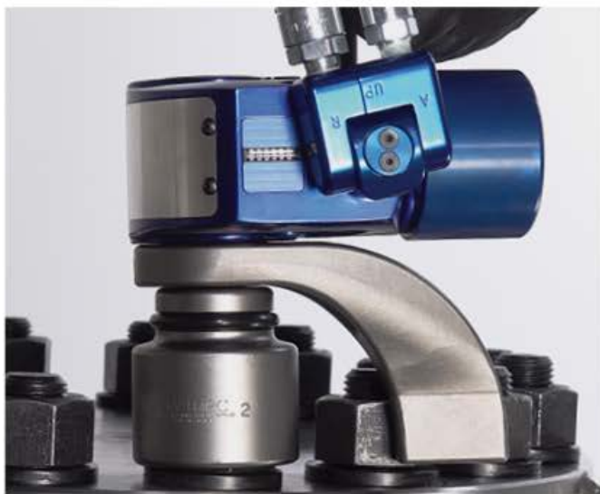
Boulonnage avec Bras de Réaction à Entraînement à Cannelures