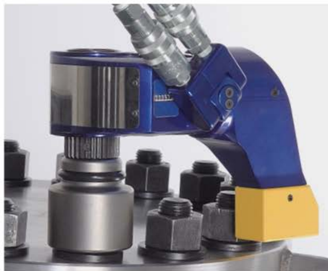
Boulonnage avec Bras de Réaction à Cannelures Arrière