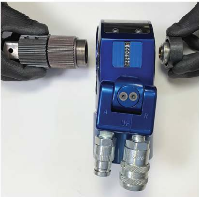
Configuration de l'Outil pour le Serrage