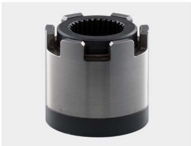
Écrou HYTORC Nut