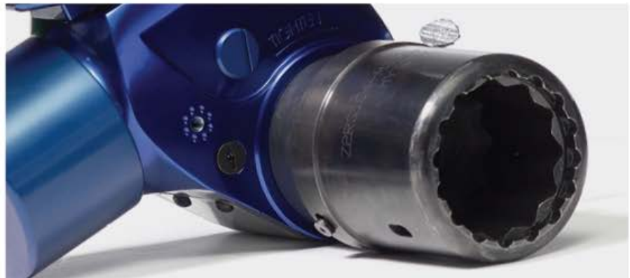
Cloche Driver Rondelles HYTORC