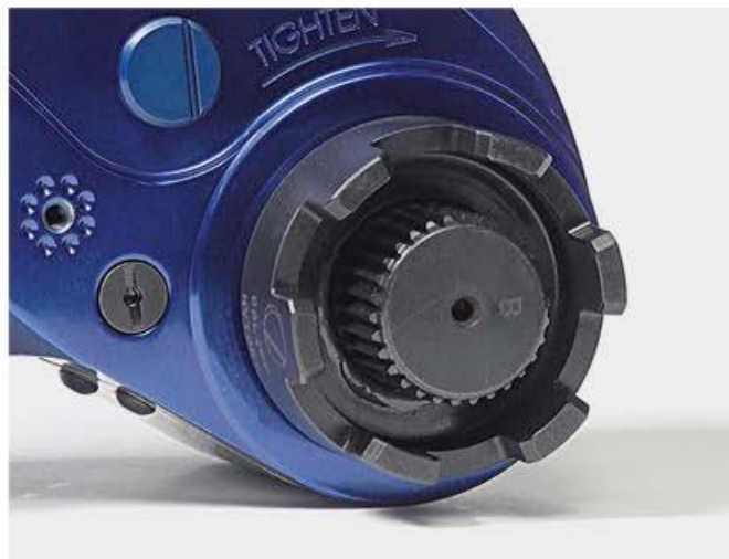
Cloche HYTORC Nut Direct Drive