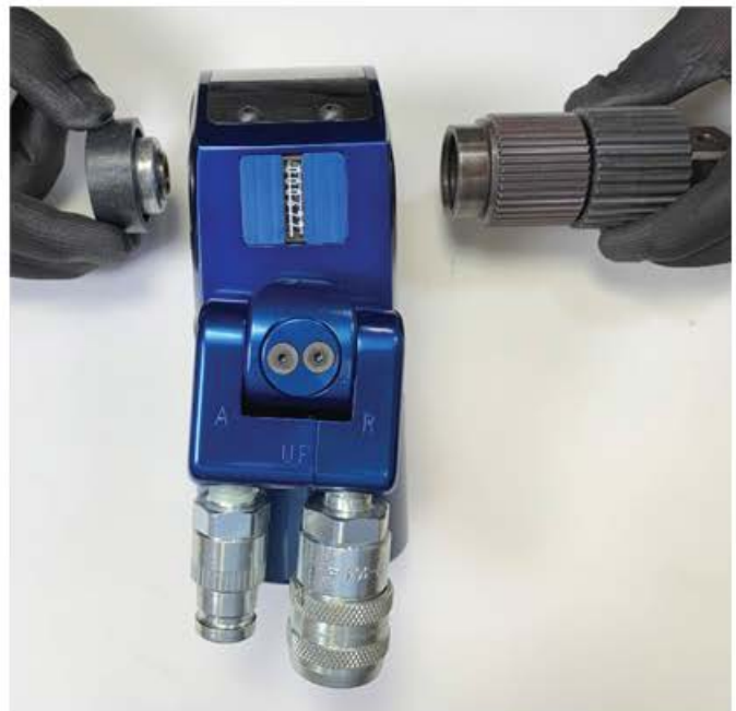
Configuration de l'Outil pour le Déserrage